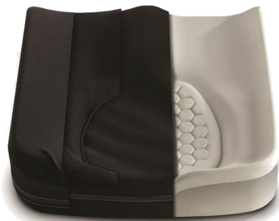
アクシオム SP ヴィスコ